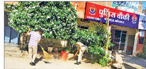
फतेहाबाद। थाने में साफ-सफाई करते पुलिस कर्मचारी।

और क्राइम यूनिट में सफाई के साधन-साथ सौंदर्यीकरण के वृक्षारोपण, रंगाई-पुताई, दस्तावेज प्रबंधन, और अनुपयोगी वस्तुओं की छंटाई जैसे कार्य नियमित रूप से हो रहे हैं। इस अभियान की