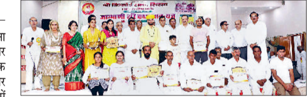
सिरसा। अतिथियों व अवाल रहे विद्यार्थियों को सम्मानित करते आयोजक।