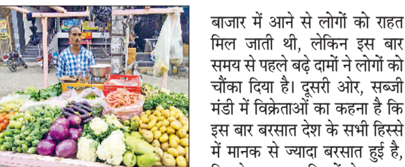
फतेहाबाद। रेहड़ी पर सजी सब्जियां।

गाए है। इससे लोगों को घर में मैनेज करना पड़ रहा है। लोगों का आरोप है कि इस बार बरसात देश के सभी हिस्सों में मानक से ज्यादा बरसात हुई है, जिसके कारण सब्जियों के फसल पर विपरीत असर पड़ा है। सप्लाई कम होने की वजह से दाम में उछाल आ रहा है, जिसका फलहाल कोई समाधान भी नहीं है। नई फसल के तैयार होने के बाद ही राहत की उम्मीद है।