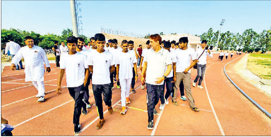
टोहाना। दमकौरा स्टेडियम में खिलाड़ियों से बातचीत करते सांसद सुभाष बराला।

राज्यसभा सांसद सुभाष बराला ने कहा कि प्रधानमंत्री नरेंद्र मोदी के आह्वान पर सांसद खेल महोत्सव का शुभारंभ होने जा रहा है। यह आयोजन युवाओं को खेलों के माध्यम से राष्ट्र निर्माण में सक्रिय भागीदारी के लिए प्रेरित करेगा और उनकी प्रतिभा को राष्ट्रीय एवं अंतरराष्ट्रीय स्तर तक पहुंचाने का अवसर प्रदान करेगा। सांसद सुभाष बराला रविवार को दमकौरा स्टेडियम पहुंचे और खिलाड़ियों को इस महोत्सव में भाग लेने के लिए प्रोत्साहित किया। उन्होंने कहा कि खिलाड़ी 20 सितम्बर तक इस प्रतियोगिता के लिए पंजीकरण करवा सकते हैं और अपनी रुचि के अनुसार प्रतियोगिताओं में हिस्सा