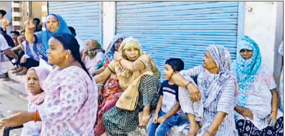
सिरसा। दूषित पेयजल सप्लाई व सीवर ओवरफ्लो के खिलाफ जाम लगाते मोहल्लावासियों।

शहर के वाल्मीकि चौक के लोगों ने रविवार को दूषित पेयजल व ओवरफ्लो सीवरज समस्या को लेकर प्रशासन के खिलाफ नारेबाजी की और सड़क पर जाम लगा दिया। सड़क जाम के चलते शनिवार से सिरसा और सिरसा से शनिवार की दिशा में जाने वाले वाहनों की कतार लग गई। क्षेत्रवासियों ने बताया कि उनके मोहल्ले में पिछले लंबे समय से पीने के पानी में सीवरज युक्त पानी मिश्रित होकर आ रहा है, इस संबंध में उन्होंने विभाग को कई बार सूचित किया परंतु अधिकारियों ने कोई सुनवाई नहीं की।