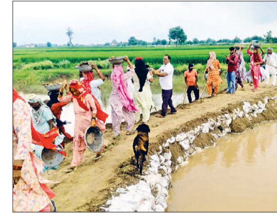
फतेहाबाद। गांव मट्ट में कटाव भरने के काम में जुटे मनरेगा मजदूर।