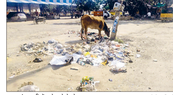
भट्टकला। मण्डी में लगे कूड़े के ढेर।

भट्टू में सफाई व कचरा उठाने के टेंडर होने के बावजूद यहां कचरा नहीं उठाया जा रहा है। न यहां सफाई होती है। हालात यह हैं कि मण्डी व आसपास के क्षेत्रों में जगह-जगह कचरे के ढेर लगे हैं। चारों तरफ बदबू फैली हुई है। सफाई व्यवस्था बुरी तरह चरमरा गई है। यहां आने-जाने वाले व्यापारियों, किसानों और आम नागरिकों को भारी परेशानियों का सामना करना पड़ रहा है। सबसे चिंताजनक बात यह है कि कूड़ा लंबे समय से नहीं उठाया जा रहा, जिससे बदबू फैल रही है और संक्रमण फैलने का खतरा भी बढ़ गया है। स्थानीय लोगों का कहना है कि कई बार शिकायत करने के बावजूद भी कोई सुनवाई नहीं हो रही। कूड़ा उठाने का टेंडर पहले ही दिया जा चुका है, इसके बावजूद सफाई व्यवस्था पूरी तरह ठप पड़ी हुई है। मार्केट कमेटी के अधिकारी इस मुद्दे पर चुप्पी साधे हुए हैं। न तो कोई अधिकारी जवाब दे रहा है और न ही कूड़ा उठाने के लिए कोई कदम