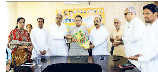
फतेहाबाद। विधायक विनोद भ्याना का स्वागत करते बीजेपी जिलाध्यक्ष प्रवीण जोड़ा व पूर्व विधायक दुड़ाराम।

हांसी के विधायक एवं फतेहाबाद विधानसभा के प्रभारी विधायक विनोद भ्याना रविवार को बीजेपी जिला कार्यालय में पहुंचे। यहां पहुंचने पर भाजपा के जिलाध्यक्ष एडवोकेट प्रवीण जोड़ा व फतेहाबाद के पूर्व विधायक दुड़ाराम ने उनका स्वागत किया। विनोद भ्याना ने यहां भाजपा जिला पदाकारियों के चर्चा की तथा फतेहाबाद विधानसभा की बैठक ली। बैठक की अध्यक्षता जिलाध्यक्ष प्रवीण जोड़ा ने की। इस बैठक में सभी जिला पदाधिकारियों, मंडल अध्यक्षों व मंडल पदाधिकारियों ने भाग लिया। बैठक को संबोधित करते हुए कहा कि