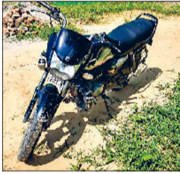
भूना। हादसे का शिकार हुआ मोटरसाइकिल।