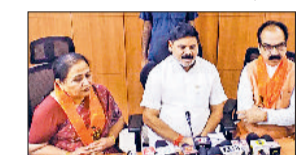
सिरसा। पत्रकारों से बातचीत करते हुए केंद्रीय राज्यमंत्री सतीश चंद्र दुबे।

केंद्रीय कोयला एवं खान मंत्रालय राज्यमंत्री सतीश चंद्र दुबे ने कहा कि किसानों के साथ केंद्र व राज्य सरकार पूरी मजबूती के साथ खड़ी है। किसानों की समस्याओं के संबंध में केंद्र व राज्य सरकार के समक्ष मजबूती से मुद्दों को रखा जाएगा और समस्याओं का निवारण करवाया जाएगा। जलभराव सहित फसल बीमा को लेकर किसानों ने जो सुधार की मांग रखी है, उस पर भी कार्यवाही की जाएगी। उन्होंने कहा कि जिला सिरसा के दौरे के दौरान उन्हें जो भी समस्याएं या मांग आमजन की तरफ से मिली है और विभिन्न गांवों का दौरा कर जायजा लिया गया है, उस बारे में प्रधानमंत्री नरेंद्र मोदी व हरियाणा के मुख्यमंत्री नायब सिंह सैनी को पत्र लिखकर अवगत करवाते हुए मजबूती से समाधान का प्रयास करेंगे। मंत्री दूबे रविवार को सिरसा में पत्रकारों से बातचीत कर रहे थे। उन्होंने कहा कि केंद्र व प्रदेश सरकार जलभराव व बाढ़ प्रभावित क्षेत्रों के लिए बेहद चिंतित हैं। इसी के मद्देनजर प्रधानमंत्री नरेंद्र मोदी ने उनकी ड्यूटी सिरसा जिला में लगाई है। वर्षा और बाढ़ प्राकृतिक आपदा होती है, यह हमारे साहस और धैर्य की परीक्षा है। इसके बावजूद केंद्र व प्रदेश सरकार