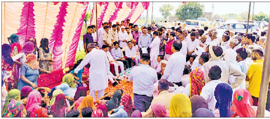
सिरसा। केंद्रीय राज्यमंत्री सतीश चंद्र दुबे ग्रामीणों की समस्या सुनते।