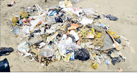
गंदगी देखकर मन हो रहा खराब